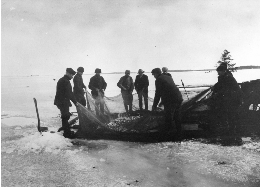
Notfiske i äldre tider